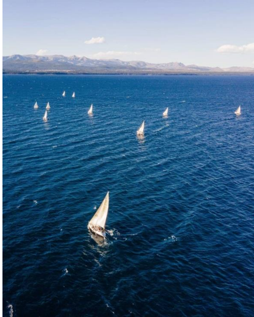
De a poco fuimos pasando barcos...