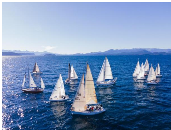
Largando sin viento...