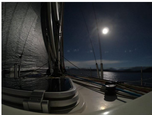
Buscando prestadas a la luz de la luna...

Luego de estar una horita flotando, empezó a aparecer una rachita en la costa y todos a buscarla con lo que se podía, icemos el spi...no que entra el Genoa... y así empezó a transcurrir toda la noche. Nuevamente el lago nos regalaba una ceñida con 4 nuditos, una luz de la luna espectacular, el Gordo timoneando super concentrado (Incluso seguía de bermudas, cuando todos ya estábamos con tres capas de abrigo, se estaba poniendo frío!) y todos buscando prestadas en las bahías, negadas en los paredones y tratando de adivinar si el barco de sotavento va más prestado o lo embocamos por nuestro lado. De a poco nos fuimos separando de la flota y quedamos solo 5 barcos en la punta más o menos en las mismas aguas.