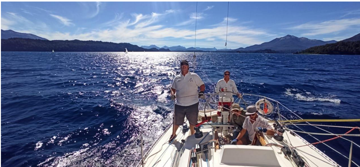
Barrenando con 20knts...

Arrancamos una popa redonda de 20 millas, con unos 18 knts. que fueron subiendo hasta 30 knts. Me tocó timonearla a mí, con el Gordo llevando el globo, por suerte nos conocemos mucho navegando juntos hace años, lo cual ayudó a que no nos lo pusiéramos el barco de gorro con cada racha cruzada que bajaba de los cerros y pasaba en un segundo de Popa a Través.