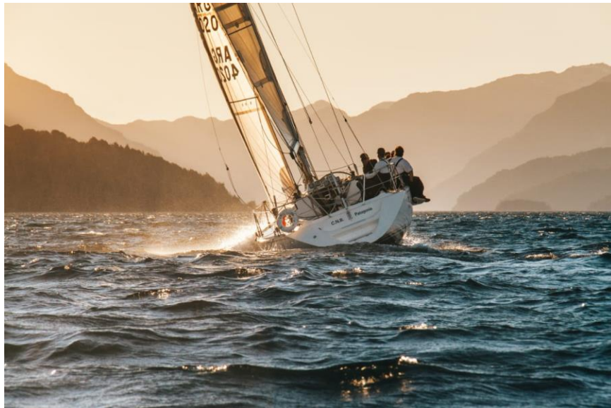
El Patagonia ciñendo al atardecer...