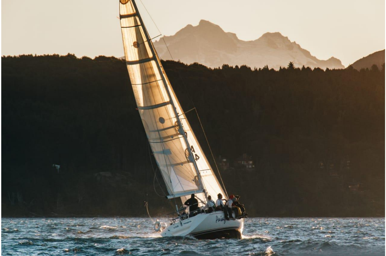
El Patagonia ciñendo al atardecer con el Cerro Tronador de fondo...

Pero todavía el lago nos guardaba otra sorpresa... a 500mts. de la llegada veníamos con 18knt. Ya relajando un poco el cuerpo y la cabeza, cuando el viento empieza a caer, 12knt...5knt... la pmqlp...quedó la ola...no tenemos vela, cero velocidad...peeling al G1 . Lo que hubiesen sido 5 minutos para cruzar la llegada se convierten en 30min.